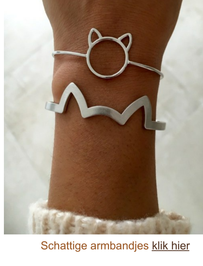
Schattige armbandjes klik hier